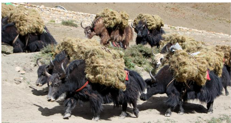
Photo de gauche : Col du Buddha ri – Photo de droite : Retour de cueillette