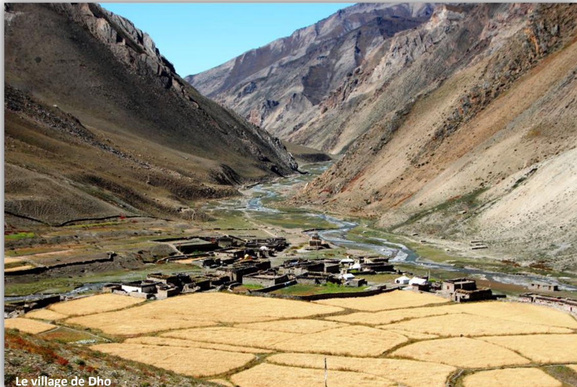
Le village de Dho