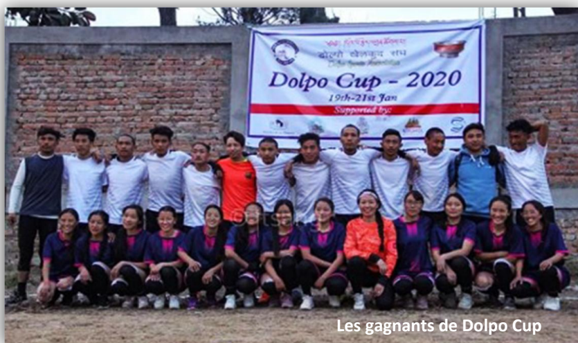
Les gagnants de Dolpo Cup

Cette année ce sont les étudiantes et les étudiants de Tarap qui ont remporté la coupe.