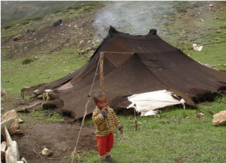
Estivage. Les gardiens des troupeaux et sa famille logent dans des tentes

d'entre eux. Les chevaux caleront vers 5000 mètres et nous laisseront terminer les 200 derniers mètres à pied. « So, so, Lha Gyalo ! » (Ndlr : « Gloire, gloire, les dieux ont vaincu. », chanté par les Tibétains au passage des cols). Un vent violent fait s'envoler les prières des drapeaux vers le ciel, tandis qu'une migration d'oies sauvages, en provenance du Tibet, nous émerveille. Nous avons la chance de croiser plusieurs caravanes de yaks chargés de bois. L'acheminement du bois au Dolpo est vraiment crucial. Les paysages sont à couper le souffle – au propre comme au figuré – et Kedar est heureux de cheminer avec nous en direction de Phoksumdo.