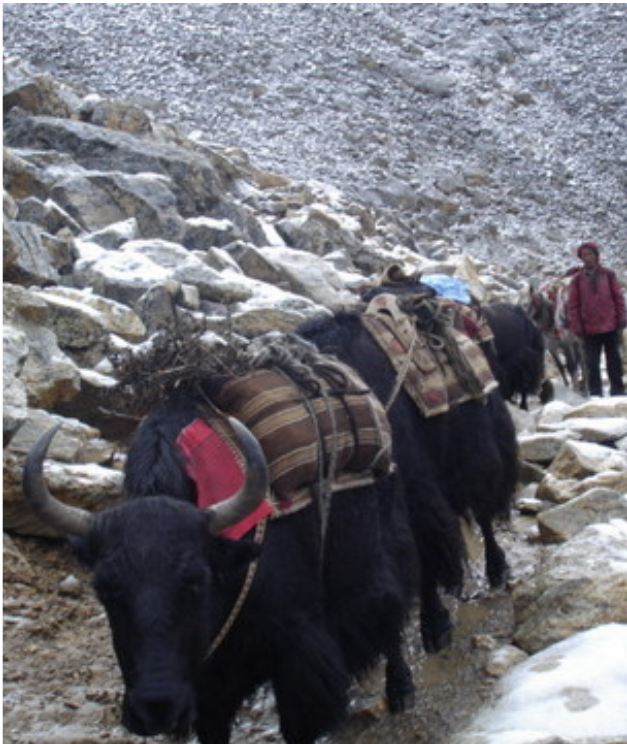
Caravane de yaks