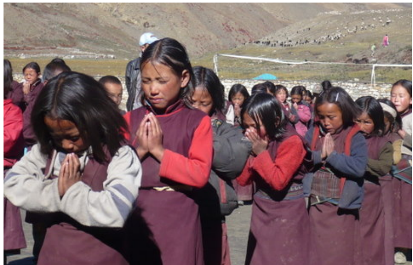
Des enfants de CMS dans le recueillement

Ma filleule a déjà perdu 4 frères et sœurs. Son père, lama et amchi, l'a récemment «rebaptisée» fin de détourner les «mauvais esprits» ! Toute intimidée par ma présence au monastère, elle part en courant vers l'école, mais le dernier jour elle viendra me dire au revoir et Rendez-vous à Snow Leopard