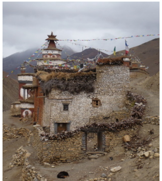
Le monastère de Ribo Bumpa

Dans ce contexte, les régions montagneuses du Nord Ouest, complètement isolées du reste du pays, concentrent de nombreux facteurs de vulnérabilité : catastrophes naturelles à répétition (dont une importante sécheresse début 2006 dans la région Karnali), prévalence élevée de la malnutrition, accès limité à la nourriture, absence de structures de santé et de transport, isolement, etc. De surcroît, la guerre civile y a laissé des traces en démultipliant ces problèmes structurels.