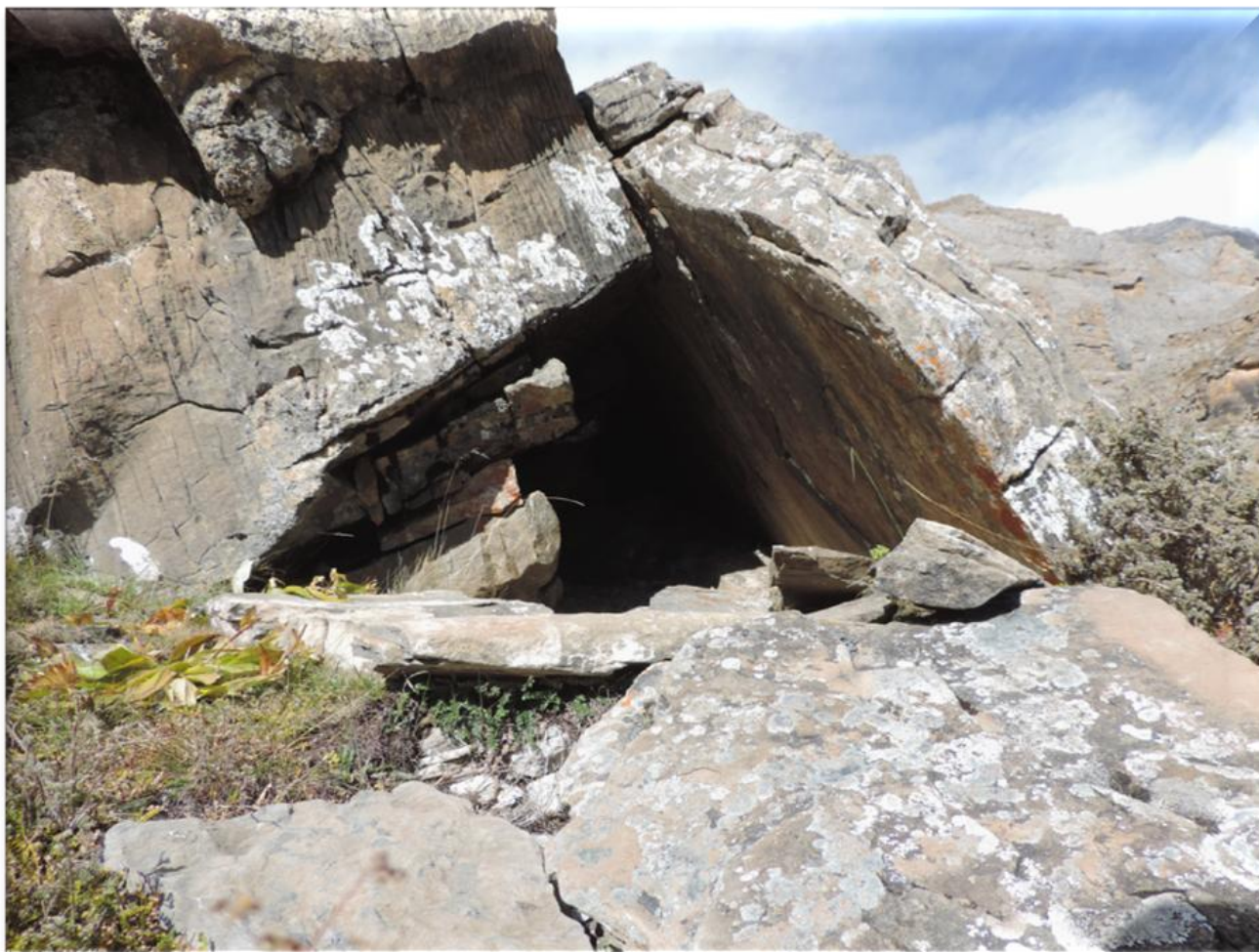
« Le rocher du péché »

L'éducation apportée par Action Dolpo depuis de nombreuses années porte ici ses fruits et cela justifie tous les efforts consentis depuis le début. Nous avons formé des hommes libres, toujours debout malgré l'adversité, et capable de se défendre. J'espère que justice leur sera rendue un jour. En plus du vol de toute une communauté, il y a eu deux meurtres laissant des familles complètement